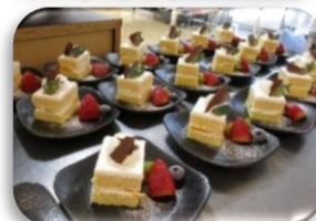
手作りケーキ いただきました