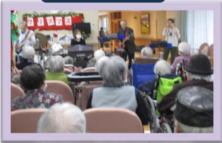
大正琴演奏 おひさま