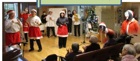
ハンドベルや 職員の出し物 (踊りや歌)を 楽しみました