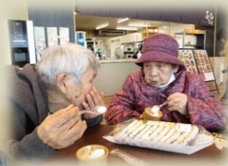
めぐみ白山で ソフトクリーム & 買物