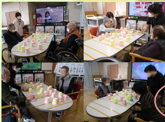
紙コップ 神経衰弱