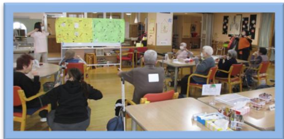
みんなですごろく体操！

「みんなの幸せ みんなでつくる つるべ荘」感謝・ やさしさ・あたた かさを大切に という施設理念 にちなんだス トーリーでした