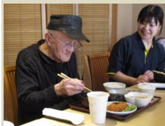
コロッケ定食(刺身付き)